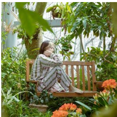
スペシャルゲストの kojikoji