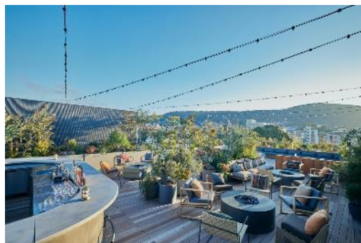
京都の街並みを一望できるルーフトッパー

館内レストラン「CICON」でご利用いただける5,000円分のレストランクレジットが付いた「アニバーサリー宿泊プラン」を販売いたします。バラエティ豊かな人気の朝食ブッフェやランチはもちろんの事、期間限定のアニバーサリーディナーやルーフトッパーで京都の夜景を眺めながらカクテルを楽しむなど、心に残る美食体験とともに、特別なひとときをお過ごしください。