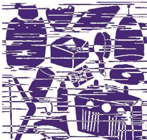
風呂敷デザインイメージ