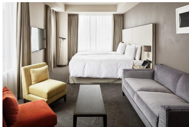
デラックスツインルーム