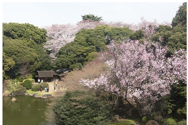
東京国立博物館の庭園を散策しながらお花見を楽しんでいただけます。