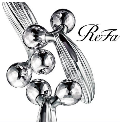
ReFa CARAT RAY

エステティシヤンの手法「ニーディング」を再現したローラーの深くつまみ流す動きで、艶やかに輝く、引き締まった肌へ。フェイスケア、ヘッドケア、ネックケア、二の腕ケア、バストケア、ウエストケアにご使用いただけます。