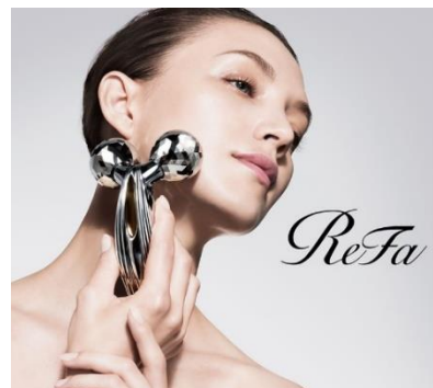
ReFa CARAT RAY

「ReFa」は、2009年に日本で誕生し、「世界の人々に楽しみながら美しくなりたい」という強い想いのもと、美しさへとつながる「こころが弾む時間」を大切に、新しい美容の形をどんどん生み出し続けています。美容に興味がある人はもちろん、それほど気にされていない人でも一度は目にしたことがあるであろう美容ローラー「ReFa CARAT」をはじめ、注目のアイテムを多数ラインアップ。機能性はもちろん、肌当たりのよさや手に馴染むフォルム、眺めているだけで気分が上向きになる美しさなど、使うことが嬉しくなるデザインを追求して開発されているのも大きな特徴のひとつです。