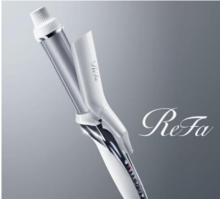
ReFa BEAUTECH CURL IRON

ReFa 独自の技術「カーボンレイヤープレート」が、水・熱・圧をコントロールして美しい立体感がつく“レア髪カール”を実現します。