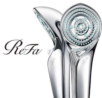
ReFa FINE BUBBLE S

※ミスト水流 1 mL あたり (水温 40℃±1℃・水道蛇口流量 9L/分) に含まれるウルトラファインバブルとマイクロバブルの合計値 (水質・環境・時期により数値は変動します) 2020年6月2日～6月24日・計7回の測定による最大値 (平均値は約 3,150 万個) 第三者機関にて測定/ウルトラファインバブルとマイクロバブルの発生量は、シャワーヘッド通水前後に測定したバブル量の差/ウルトラファインバブル: 平均径▲約 0.15μm、最頻径▲約 0.12μm マイクロバブル: 平均径▲約 45μm、最頻径▲約 44μm