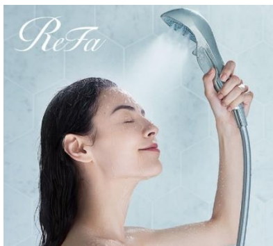
ReFa FINE BUBBLE S