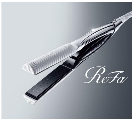
ReFa BEAUTECH STRAIGHT IRON

ReFa 独自の技術「カーボンレイヤープレート」が、ストレートアイロンによる水・熱・圧のダメージを抑えながら、髪を美しく整えるプロの“ヘアストレート”を実現します。