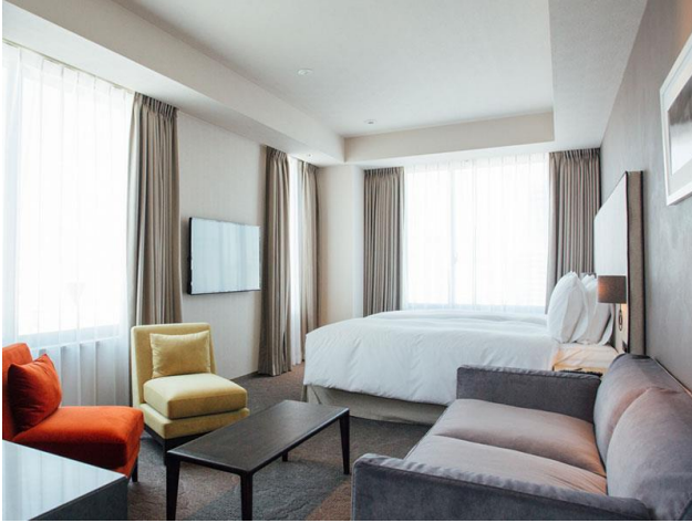
[Deluxe Twin Room]